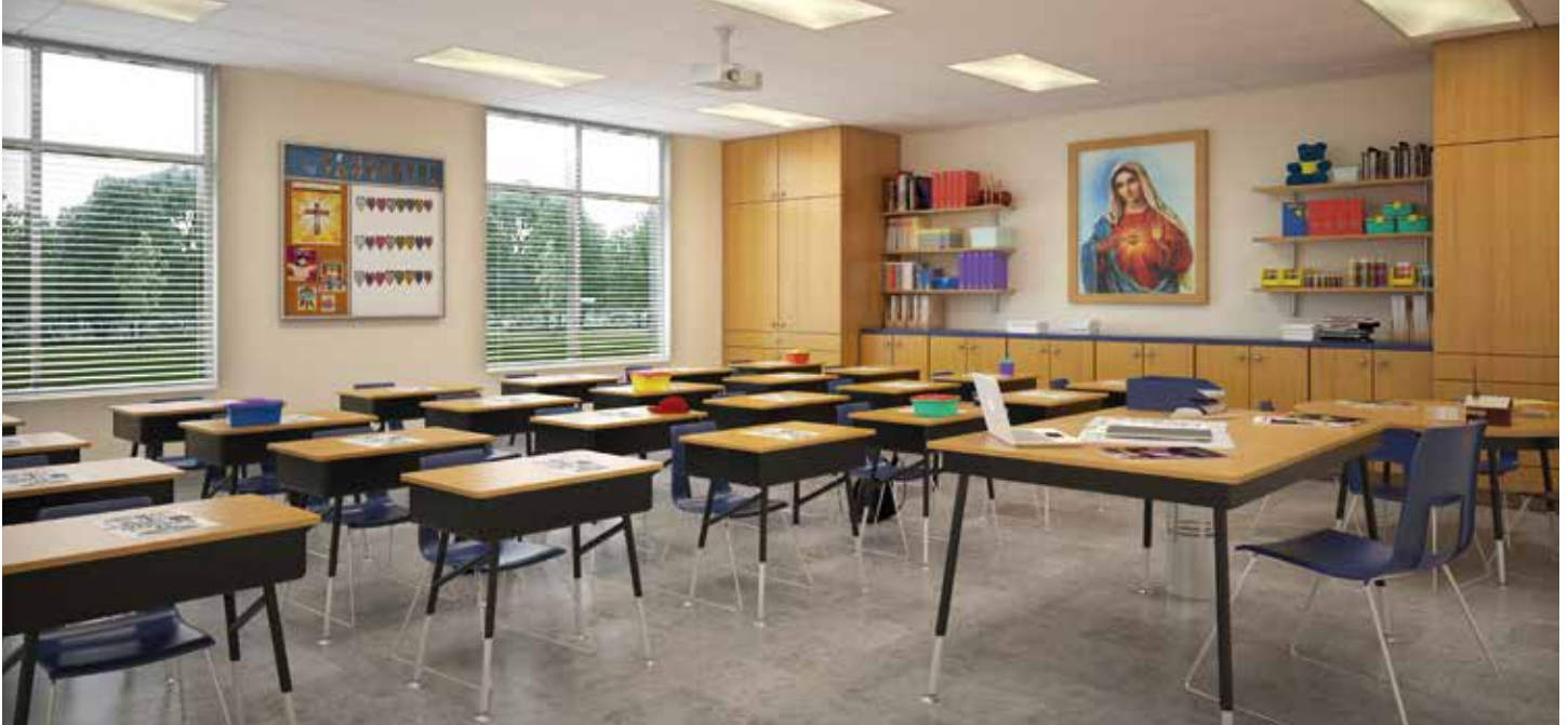
REPRESENTACIÓN DEL SALÓN DE CLASES